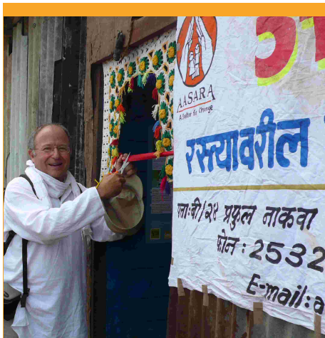
Inauguració d'una escola a Mumbai

• L'any 2.008, a Aasara Barcelona, ha estat l'any de la consolidació de l'estructura per àrees de treball i de la seva Junta Directiva a través d'una gestió professionalitzada, conservant el caràcter absolutament voluntari de tots els seus membres i el finançament personal dels viatges que s'han fet a l'Índia per a visitar els diversos centres i fer un seguiment del desenvolupament dels projectes actuals.