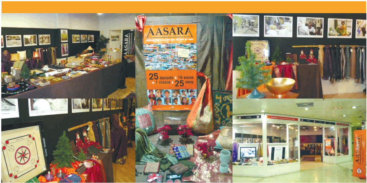
Mercat al centre de la Vila