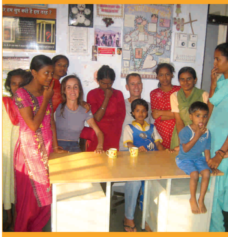
Centre de Neral

• S'han realitzat diverses accions i treballs de promoció i divulgació amb l'objectiu d'ampliar la base de donants i col·laboradors, a través de campanyes de sensibilització i transparència, incorporant empreses i institucions bancàries especialment actives en el terreny dels projectes socials com ,per exemple, a través del programa "tú eliges,tú decides" de la Caja de Ahorros de Navarra CAN.